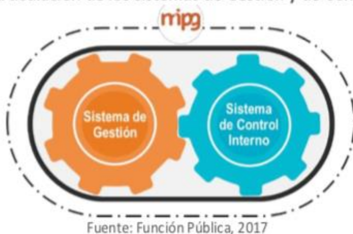
Gráfico 1. Articulación de los sistemas de Gestión y de Control Interno

Es pertinente indicar que este sistema de gestión incluye todas las entidades y organismos del estado, políticas, normas, recursos e información, cuyo objetivo es dirigir la gestión pública al mejor desempeño institucional y a la consecución de resultados para la satisfacción de las necesidades y goce efectivo de los derechos de los ciudadanos, en el marco de la legalidad y la integridad.