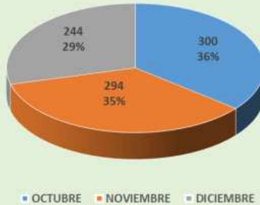
PQRD x Mes - Generadas/Atendidas octubre a diciembre de 2019