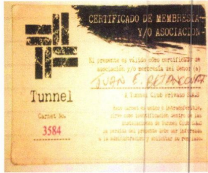
Carnet que debe acreditar cada socio.