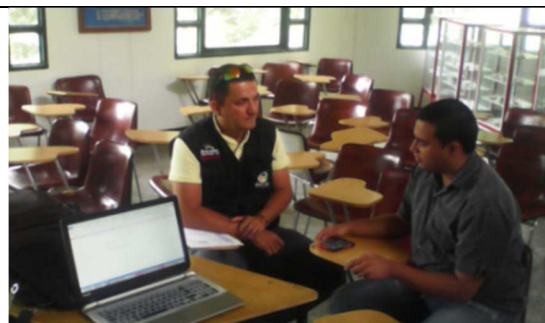
Capacitación cargue información SUI Marsella