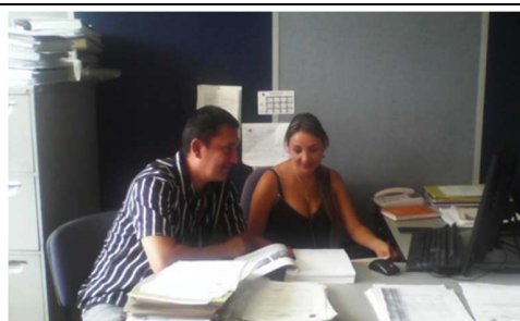
Capacitación cargue información SUI Pueblo Rico