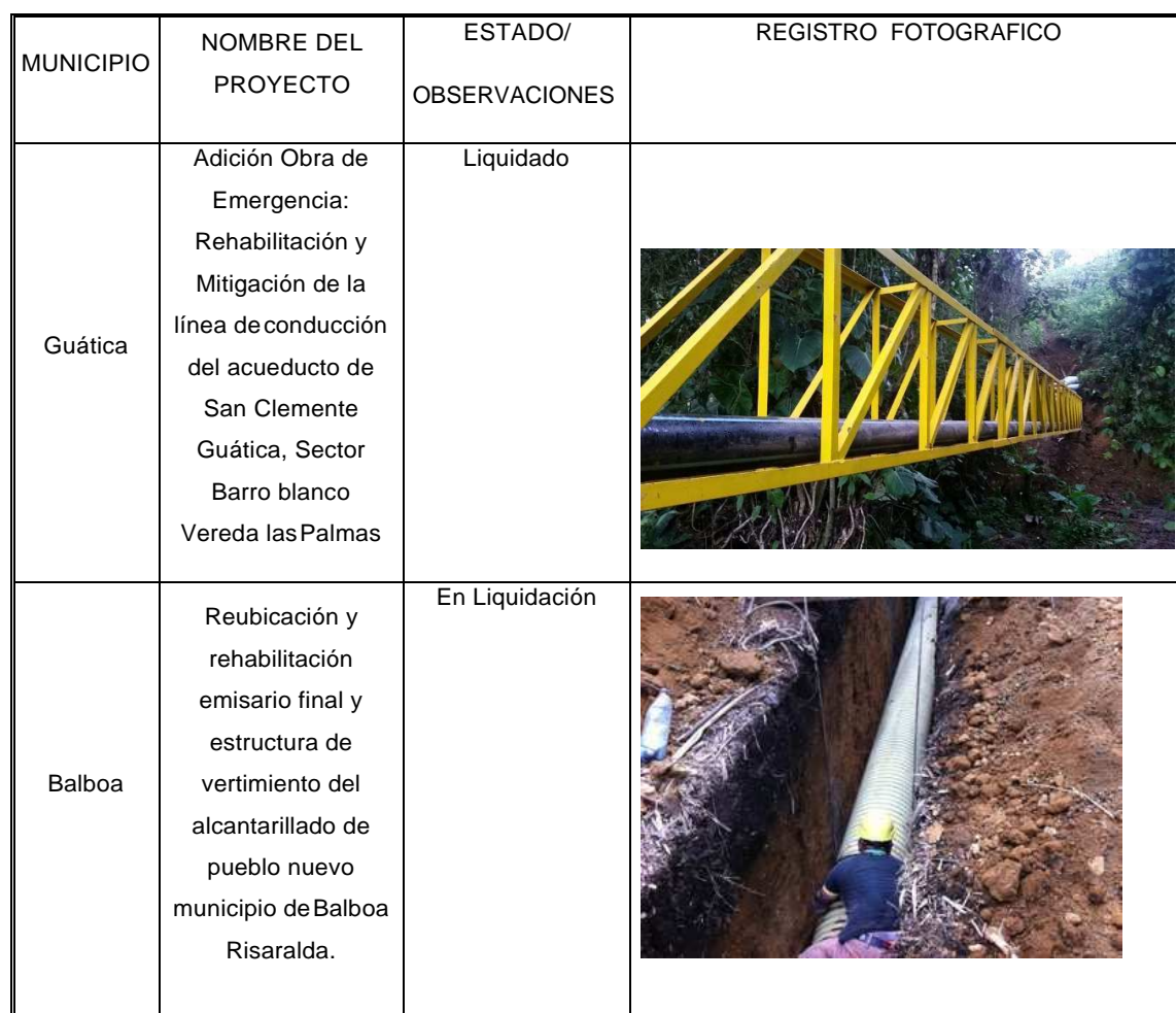
Tabla 10. Obras Mitigación de Riesgo, PAP-PDA, 2015

de remoción en masa dado por la ola invernal del año 2013 que generó el colapso de gran parte del sistema de alcantarillado del municipio de Balboa.